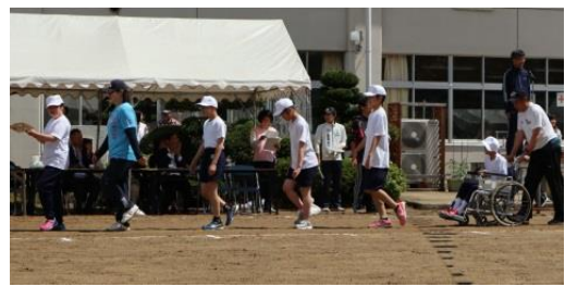
《プラカードを持って入場行進》