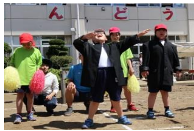
《大きな声でエール》