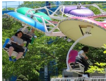
《2年生：ベニーランド》