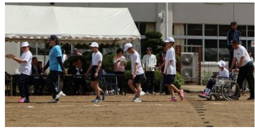
《プラカードを持って入場行進》