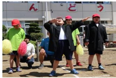
《大きな声でエール》