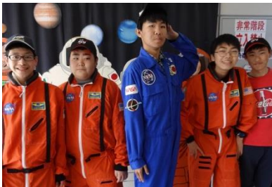
《1年生：スペースタワー》

高等部は、5月11日（金）に校外学習に行ってきました。3年生は修学旅行の練習も兼ねて、仙台空港やエアリなど、2年生はベニーランドなど、1年生は角田市内のスペースタワー・コスモハウス、郷土資料館などに行きました。どの学年も事故なく、楽しく活動することができました。公共交通機関の利用や買い物学習もしっかりできたようです。