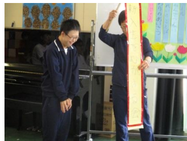
《中：新入生を迎える会》