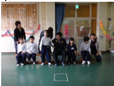
《小：新しい友達を迎える会》

4月は気温の変化が大きかったため、子どもたちはそろそろ疲れが出てくる頃ではないかと思いま す。GW中ご家庭においても健康観察をお願いいたします。また、5月には個別面談、小中学部の運 動会が開催されます。保護者の皆様のご協力をよろしくお願いいたします。